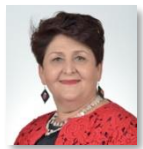
Teresa Bellanova Ministro delle Politiche Agricole Alimentari e Forestali