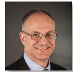
Roberto Gualtieri Ministro dell'Economia e delle Finanze