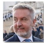
Lorenzo Guerini Ministro della Difesa